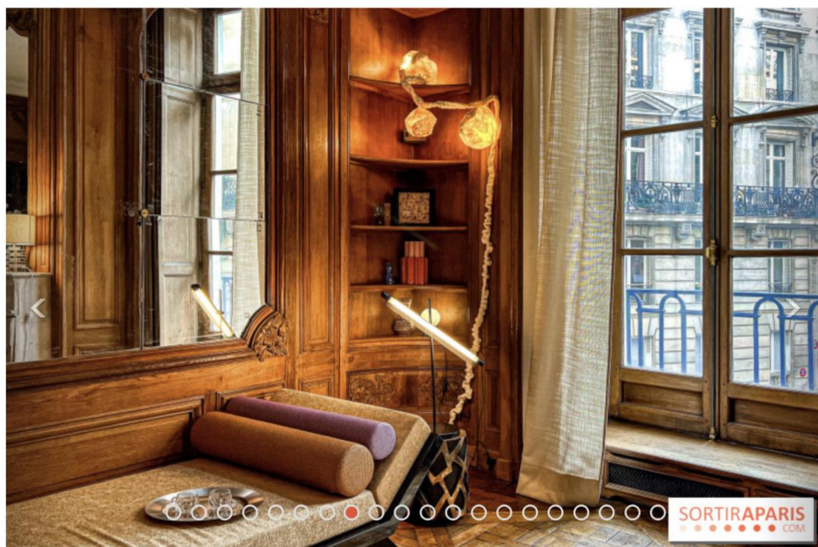
La Scopa - The Socialite Family - Exposition immersive